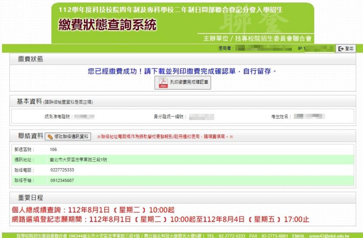
圖10 繳費成功之畫面