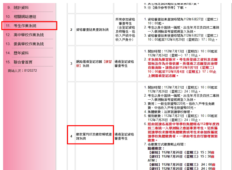
圖 1 本委員會網站「繳款單列印及繳款帳號查詢系統」超連結點選畫面