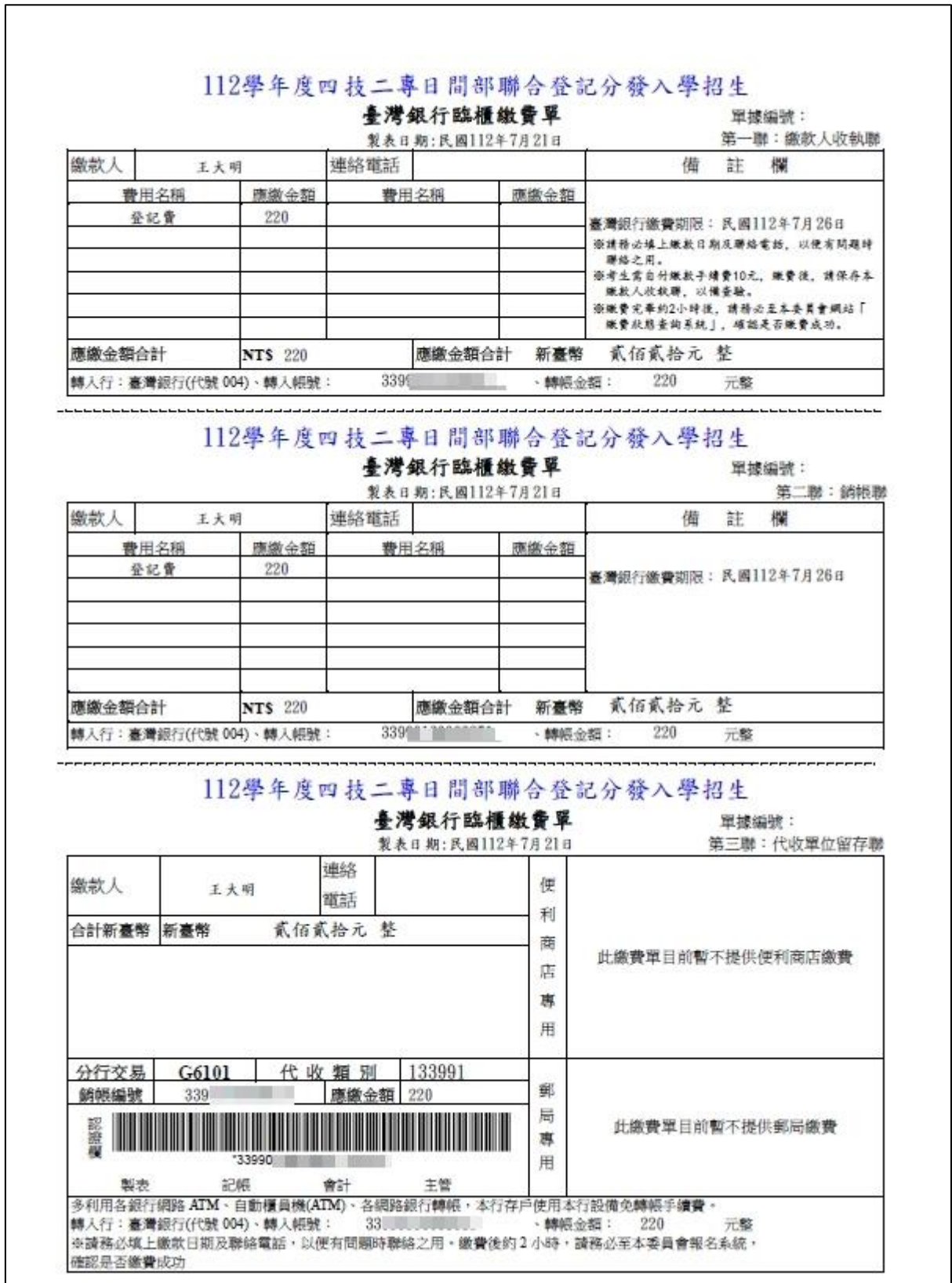
圖 6 臺灣銀行繳款單樣張