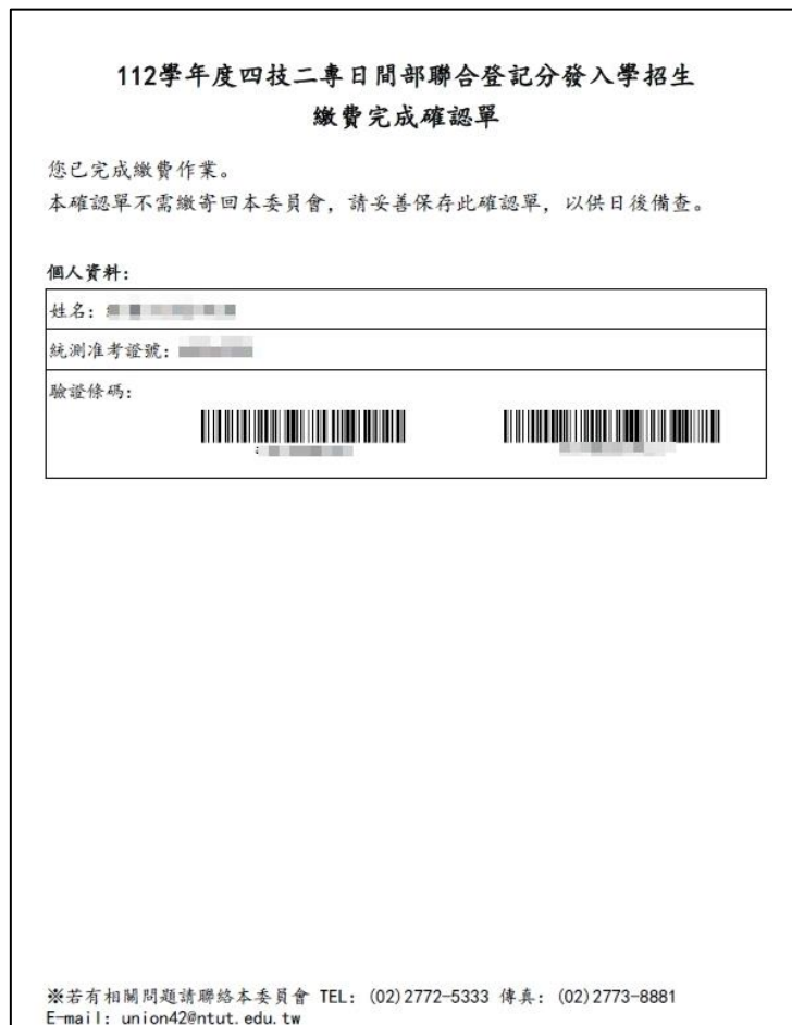
圖 15 繳費完成確認單樣張