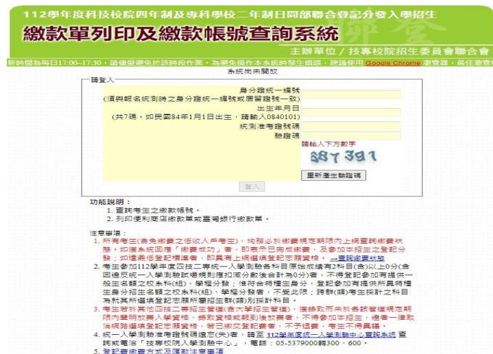
圖 2 繳款單列印及繳款帳號查詢系統登入畫面