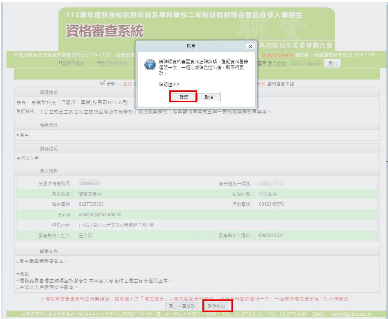
圖 15 確定送出畫面