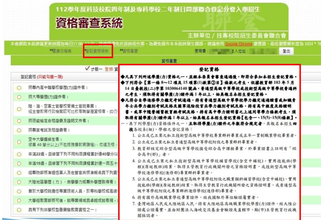
圖 5 登記資格條款畫面