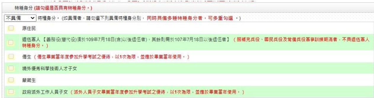
圖 8 勾選不具備特種身分畫面

2. 考生如具備特種身分，請選擇所具備之身分，並勾選相關特種身分之詳細資料(如圖 9 所示)。