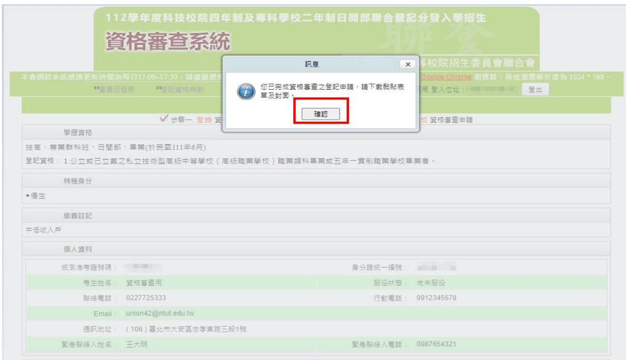
圖 16 確認完成資格審查登錄訊息畫面