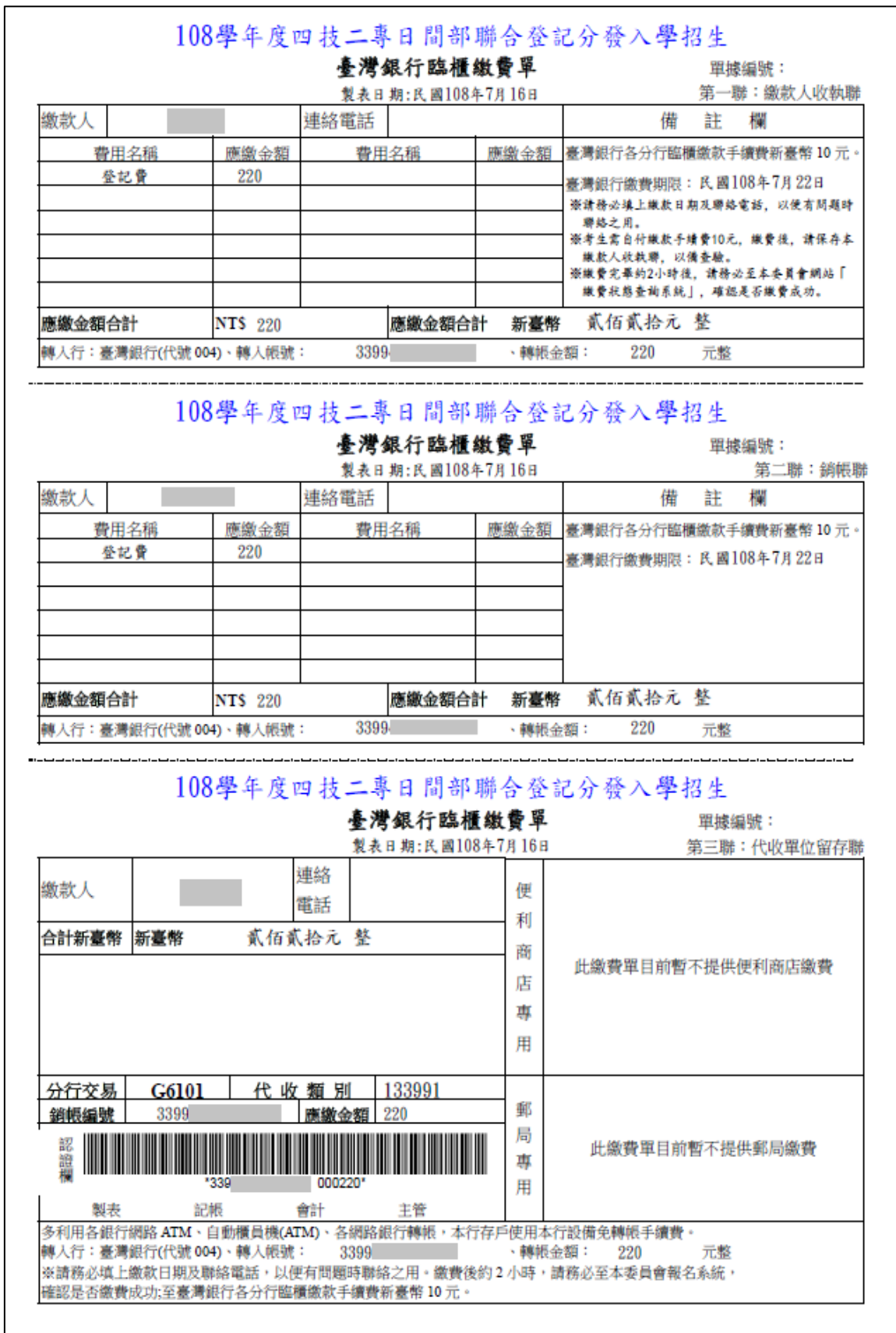
圖 6 臺灣銀行繳款單樣張