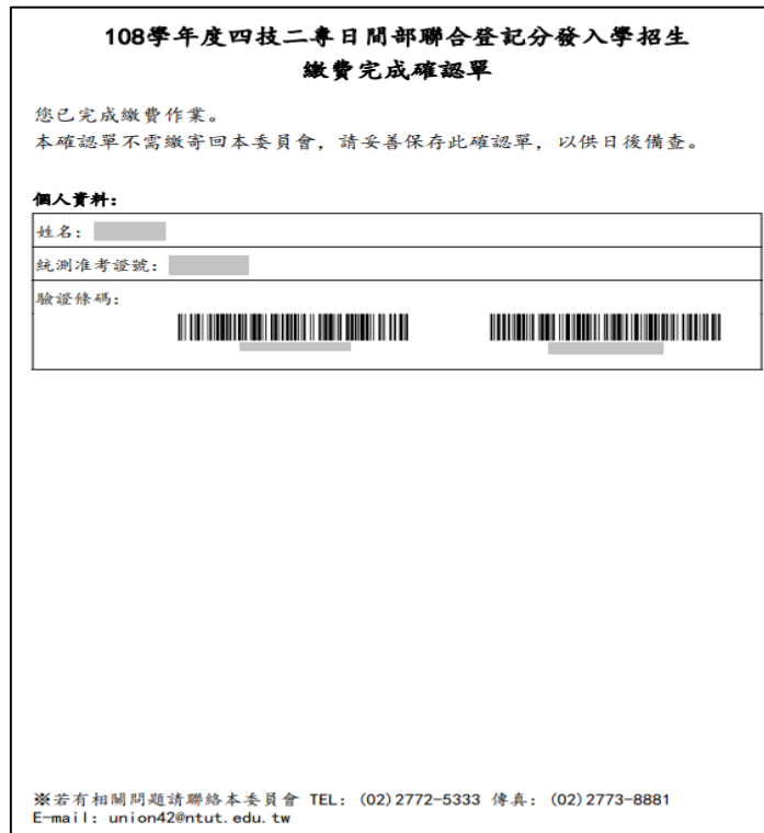
圖 15 繳費完成確認單樣張