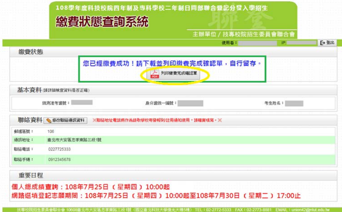
圖 14 列印繳費完成確認單之畫面