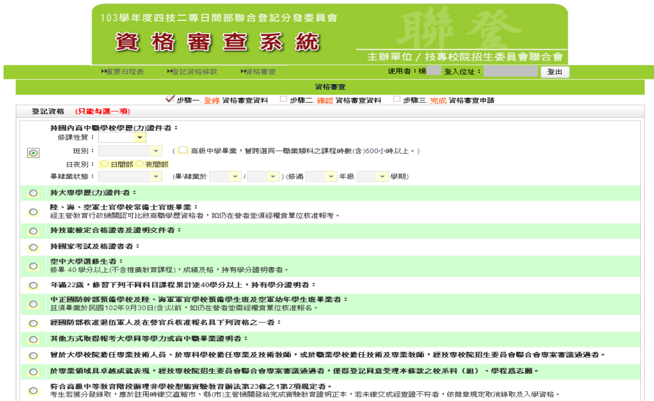
圖 6 登記資格選取畫面