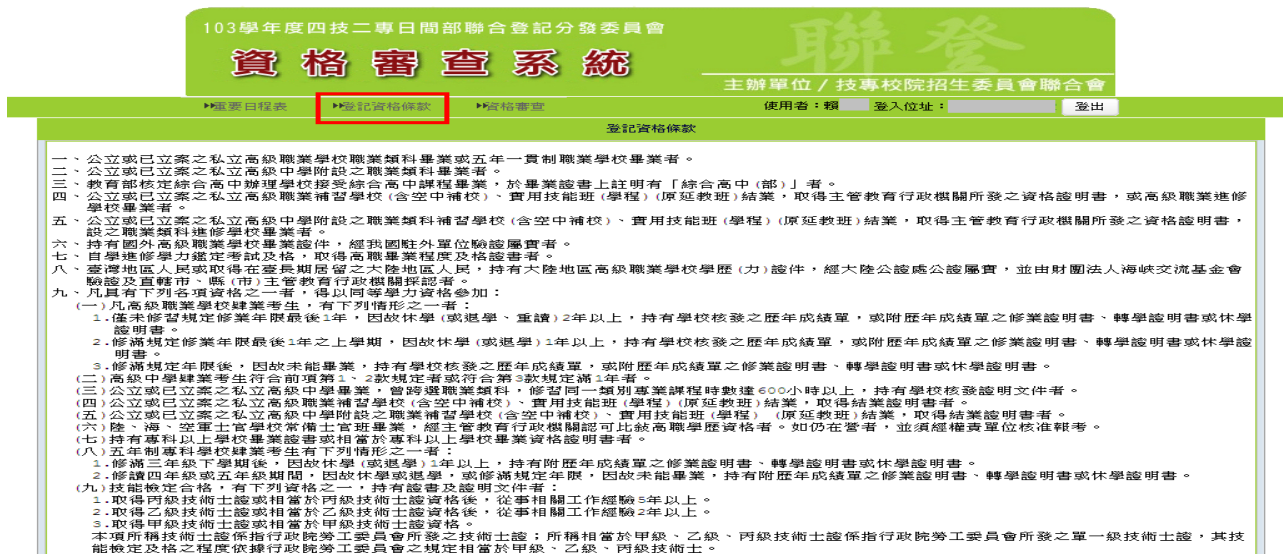
圖 5 登記資格條款畫面