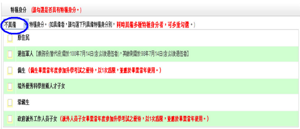
圖 8 勾選不具備特種身分畫面