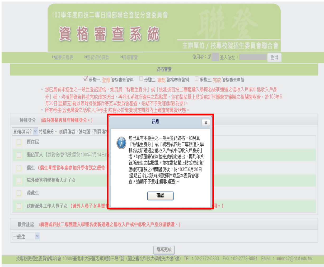
圖 7 「您已具有本招生之一般生登記資格」訊息畫面